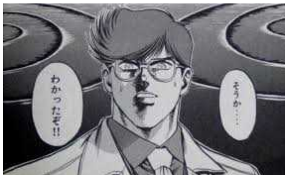
画像は 石垣ゆうき「MMR マガジンミステリー調査班」より

ということで2020年度より実施される新入試情報のリリースです！以前にも一度掲載しましたが、少しずつ情報がまとまってきたので今回はきちんとまとめておきます。特に1, 2年生は自分の将来に大きく関わるので、必ずチェックしておいてください。自分だけでなく早めに保護者の方とも情報を共有し、新入試に備えておきましょう！